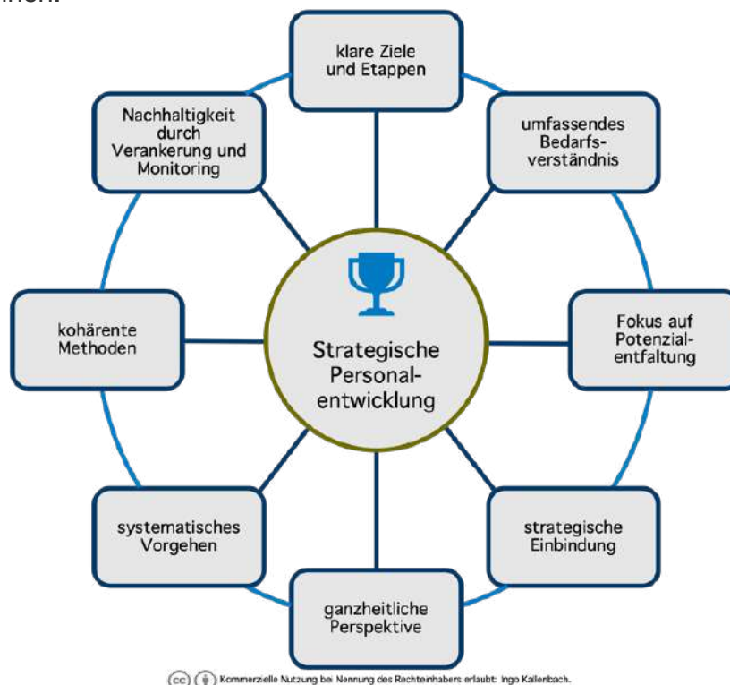
Abbildung 3: Die acht Erfolgsfaktoren in der Strategischen Personalentwicklung

Es bedarf daher der Erfüllung von acht Erfolgsfaktoren , um ein effektives Personalentwicklungsprogramm zu implementieren. In Abbildung 3 sehen Sie eine Übersicht aller Erfolgsfaktoren, anhand derer Sie Ihre firmeninterne Personalentwicklung besser beurteilen können.